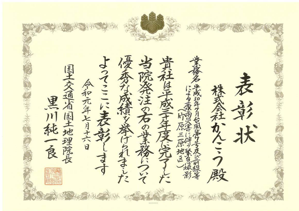
国土地理院長 優良業務表彰

また、この優良業務に従事した主任技術者が、技術力等が優れ、他の模範となる優良技術者として表彰されました。