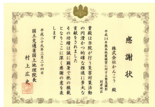
平成28年熊本地震被害に対する緊急撮影 別府地区