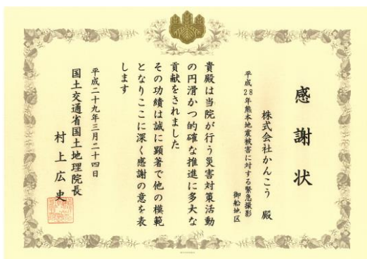
平成28年熊本地震被害に対する緊急撮影 御船地区